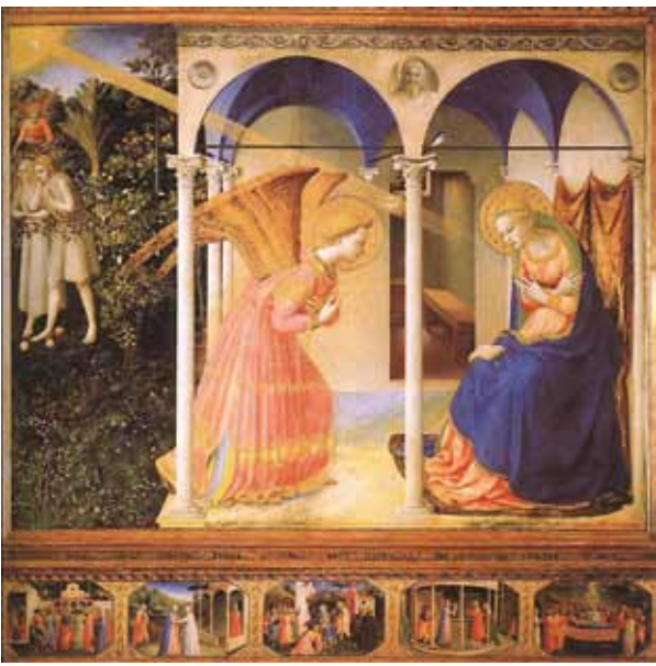
受胎告知 フラ・アンジェリコ 1430年頃 フレスコ|サンタ・マリア・デレ・グラツィエ修道院