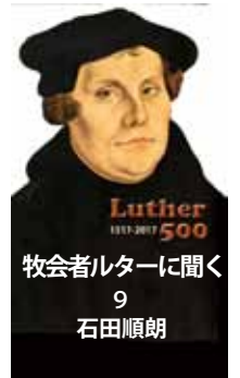
牧会者ルターに聞く 9 石田順朗