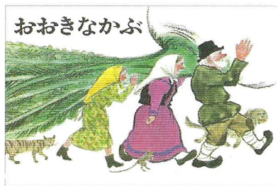
福音館書店「おおきなかぶ」ロシア民話 作:A・トルストイ 絵:佐藤忠良 訳:内田莉紗子

「やっとかぶがぬけました！」 このかぶのなんと大きなこと！ 佐藤忠良の絵とともにいつまでも心に残る絵本です。