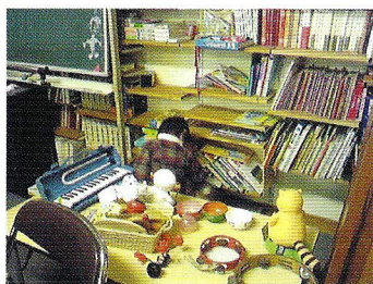
母子室のこどもコーナー

武蔵野教会母子室は2階に位置し礼拝中は、お子さま連れの方がそこで礼拝を守られ、その他の時は、話し合いに使っています。